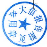
2021年度非经营性资金占用及其他关联资金往来情况汇总表